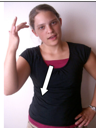
why? ¿por qué?